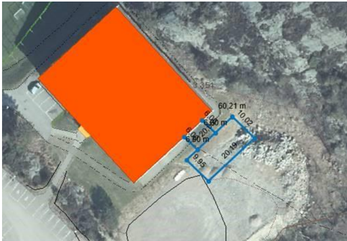
Bild 1. Placering av padelbana 20 x 10 m